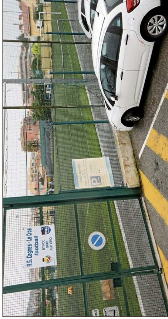
L'actuel stade Autiero : un hectare à réaffecter au Cros-Val Fleuri.